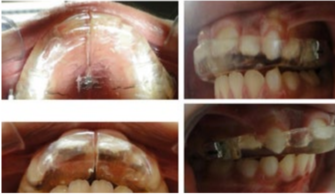
Julio 2014. Se observa plano oclusal con respecto a Camper lado derecho de clase II e izquierdo clase III.