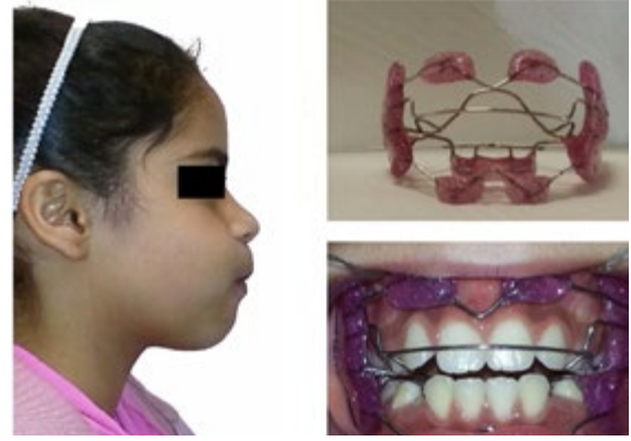
Julio 2015 Paciente en control con uso de RF1