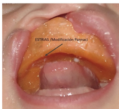
Figura 2. Vista clínica intraoral del infante con la Placa Funcional en posición, donde se observa la lengua en contacto activo con las estrías transversales talladas en la superficie acrílica (“Modificación Pannaci”, 1997). Esta interacción refleja la estimulación propioceptiva y el control funcional ejercido por la lengua sobre el dispositivo, lo que contribuye al crecimiento guiado y simétrico de los segmentos maxilares.

No se emplean elementos de retención adicionales; en caso necesario, se utilizó una mínima cantidad de adhesivo dental (Corega®). El dispositivo permaneció en uso de forma continua las 24 horas del día, retirándose solo dos o tres veces diarias para su higiene. El paciente fue controlado cada cuatro semanas durante el primer año, realizando una nueva impresión y confeccionando una nueva Placa Funcional hasta la cirugía de labio. Tras el período