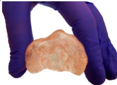
Figura 1. Vista oclusal de la Placa Funcional confeccionada en acrílico autopolimerizable (NicTone®), donde se observan tres estrías transversales y paralelas, talladas en la superficie externa del lado del segmento de menor volumen (“Modificación Pannaci”, 1997). Estas estrías confieren al dispositivo una textura diferenciada que estimula la propiocepción lingual y favorece la interacción funcional lengua–placa, orientando los movimientos linguales hacia el segmento menor para promover el crecimiento óseo controlado.

Esta modificación confiere al dispositivo una textura diferenciada, capaz de estimular la propiocepción lingual y promueve el contacto repetido de la lengua contra la superficie acrílica. La interacción lengua–placa incrementa la frecuencia y dirección controlada de los movimientos linguales hacia el segmento menor, proporcionando un estímulo mecánico localizado que promueve el crecimiento óseo del área que más lo requiere.